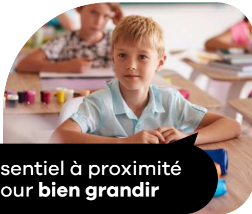
L'essentiel à proximité pour bien grandir