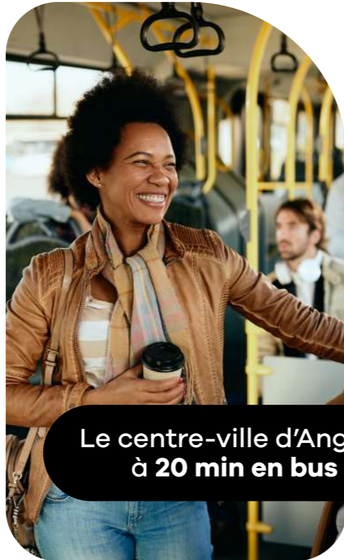
Le centre-ville d'Angers à 20 min en bus