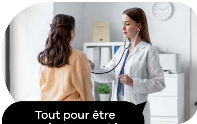
Tout pour être en bonne santé